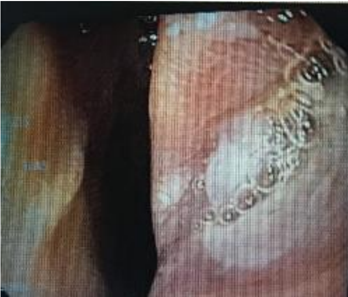
Figura 3. Enteroscopia con área de estrechez y ulceración del caso No 2