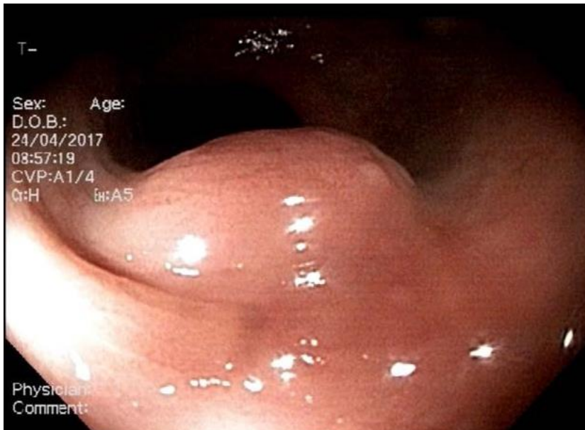
Figura 1 Colonoscopia: Lesión sub-epitelial en la unión rectosigmoidea.

Conclusiones: Los GIST son baja prevalencia, con presentaciones menos frecuentes en yeyuno y recto; lo que puede retrasar su diagnóstico y así manejo oportuno. La base del diagnóstico es la biopsia con estudio de inmunohistoquímica, y el tratamiento curativo la resección quirúrgica: R0. Reseccion GIST de recto es el primer caso reportado en Colombia, manejado quirúrgicamente por laparoscopia.